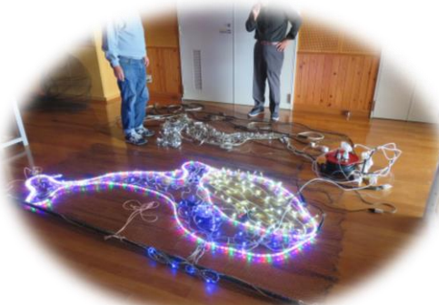
くじらのデザイン