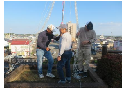
イルミネーションの設置