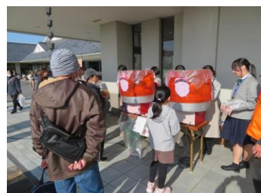
(綿菓子の無料配布)